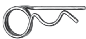
Federstecker ähnlich DIN 11024