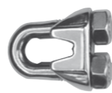
Drahtseilklemme ähnlich DIN 741, hohe Form