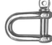
Schäkel kurze Form ähnlich DIN 82101 Form A