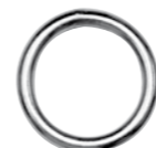
Ring geschweißt, poliert