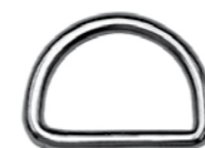
D-Ring geschweißt, poliert