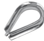
Kausche ähnlich DIN 6899